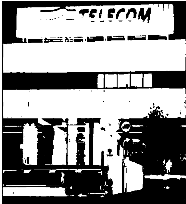
La sede di Telecom a Parco De' Medici a Roma